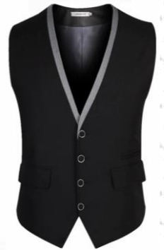
Oud kostuum: van de kringwinkel