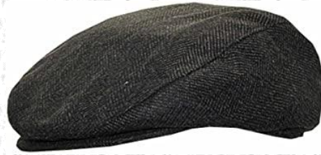
Britse klak : van de opa