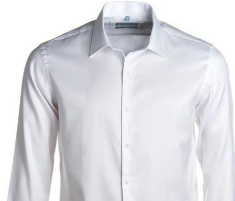
Wit hemd: van de broer