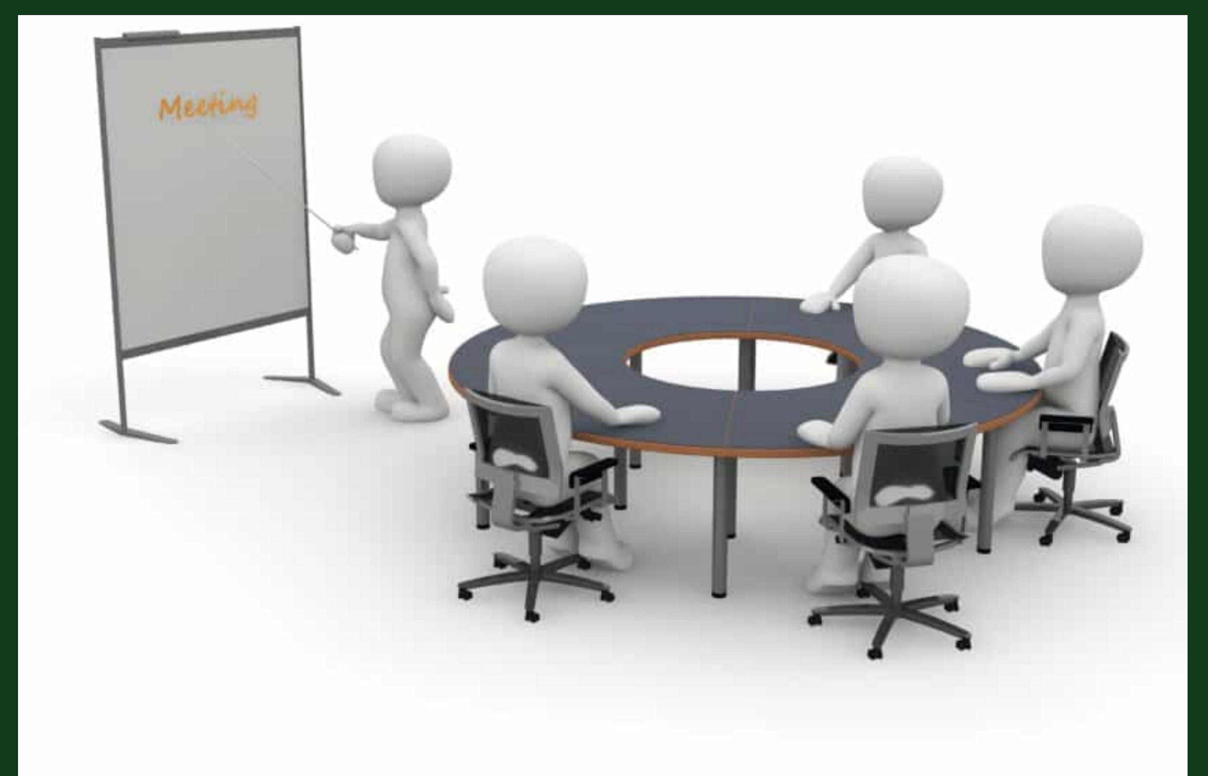
exclusieve reconstructie van een leidingsweekend

(De redactie is emotioneel op dit moment)