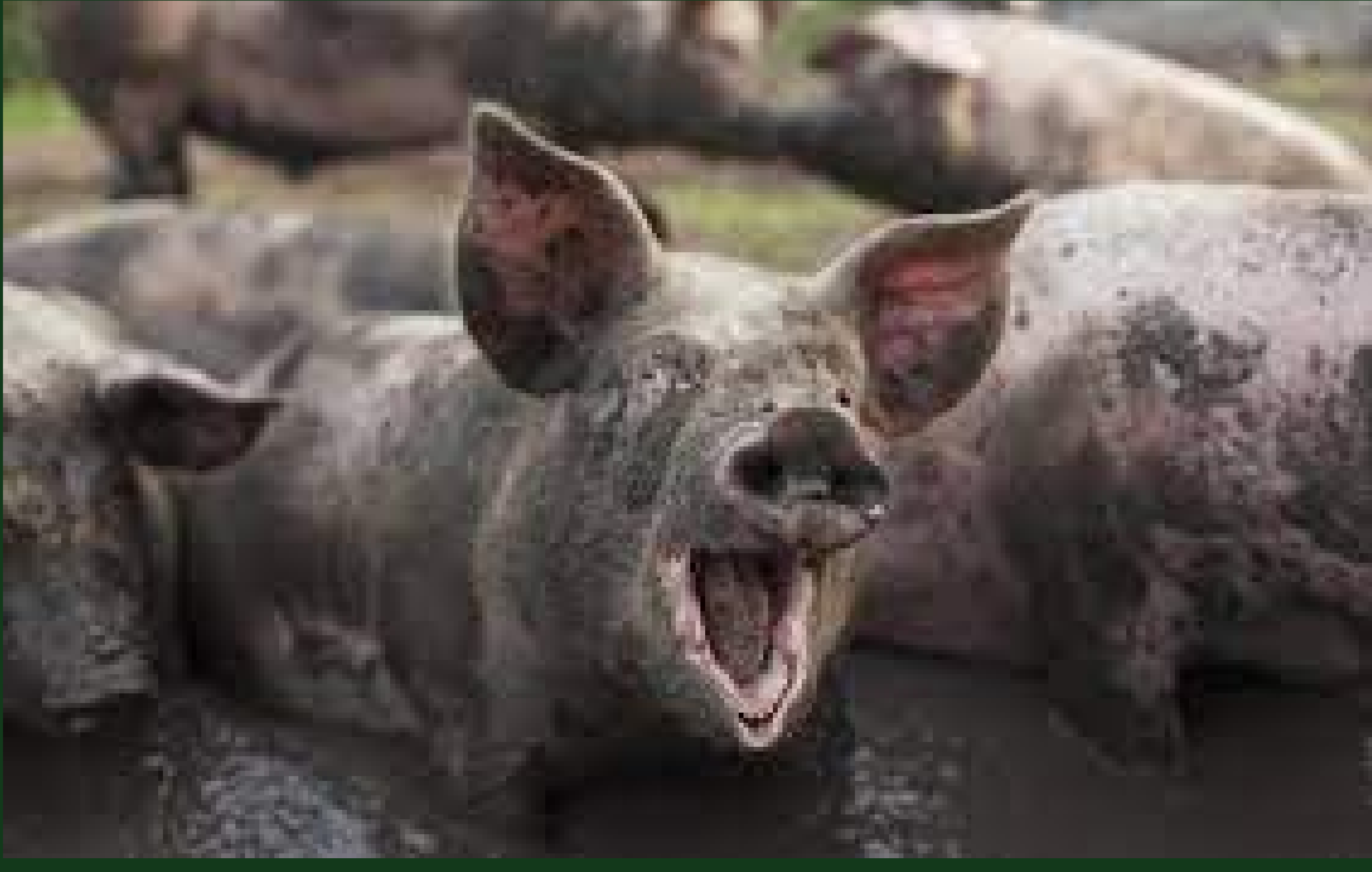
De gemiddelde Jv na moddertocht

Wat gaat er hand in hand met de maand oktober?