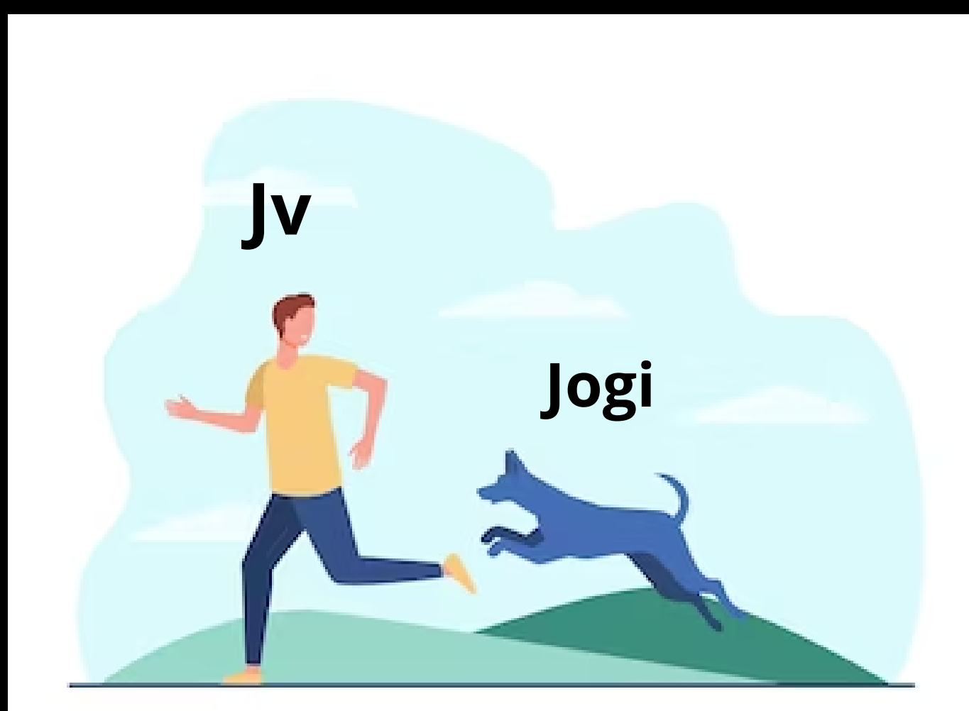
zie hier een bange Jv

Wie is de grootste charmeur? Wie is de grootste casanova? Wie heeft zijn zwoele blik al eens geoefend? Wie is er het galantst? Maar het belangrijkste, wie gaat de valentijns vergadering winnen?