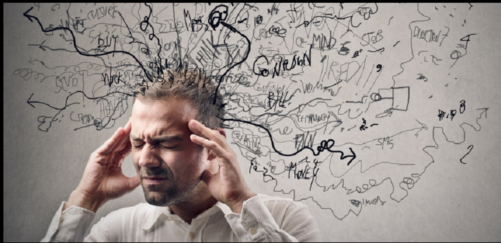
De gemiddelde Jv die er op dit moment niks van snapt